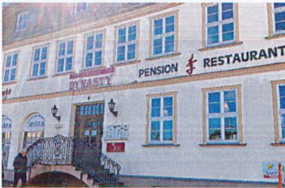
Das neue vietnamesische Restaurant „Dynasty“ will seine Gäste an der Sushi-Bar mit rohem Fisch verwöhnen.

In Neustrelitz können die Gäste nun vietnamesische Spezialitäten à la carte probieren. An der Adresse am Markt war bis vor Kurzem noch das chinesische Restaurants „Essen bei Li“ beheimatet. Es musste wegen gestiegener Einkaufspreise und den Auswirkungen der Inflation